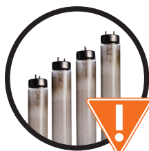
Bombillas y tubos fluorescentes 日光燈泡/燈管