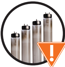
Fluorescent Bulbs & Tubes