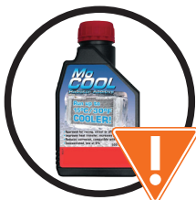
Líquidos Refrigerantes 冷卻劑