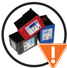
Tinta de impresora 印刷用油墨